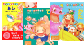
からだであそぼう「あし」「て」「かた」 (小澤直子・文、小澤るしや・え) ポプラ社, ¥1,260